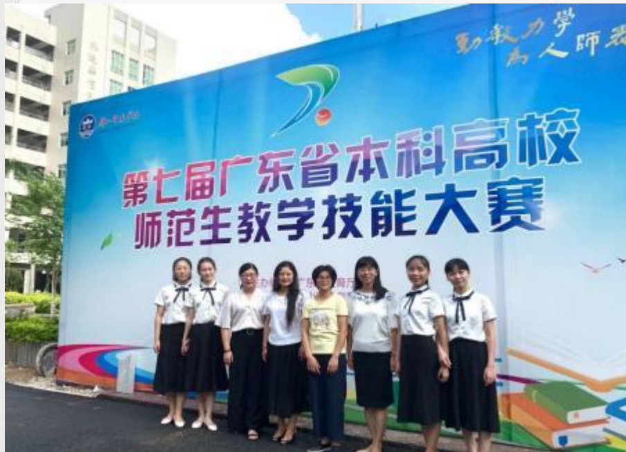
学院师生参加广东省师范生教学技能大赛合影留念（小学教育组）