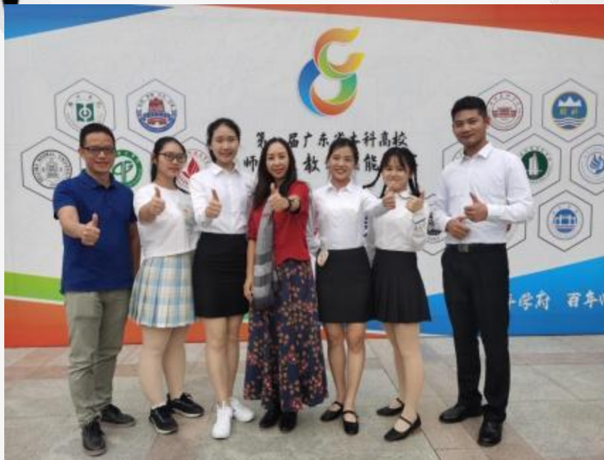
学院师生参加广东省师范生教学技能大赛合影留念（心理学组）